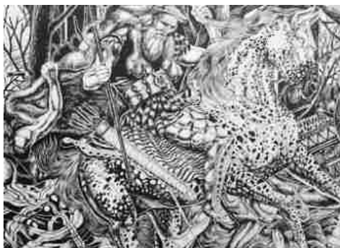
ZAMOC cà zemian

ARTE E STAGIONI, BIBLIOTECA CLASSENSE, DISEGNATORI, DISEGNO, GRAFICI, LUCA ZAMOC, MODA E BELLEZZA, OPERE ALLA CLASSENSE, RAVENNA NON SOLO MOSAICO